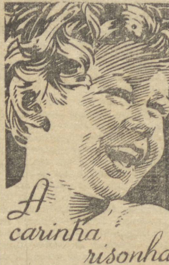
A carinha risonha

Defenda o seu organismo, tomando o bom, puro e eficaz BITER AGUA