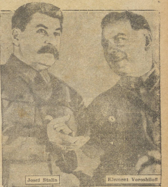
Josef Stalin e Klement Voroshiloff.

PARIS, 12 (U. P., agência norte americana) — O sr. Daldier, falando hoje na Câmara dos Deputados, declarou que a França e a Inglaterra tinham prontos para embarcar para a Finlândia 50 000 soldados, dependendo o seu embarque apenas de um pedido oficial do governo finlandês, pois tendo a Noruega e a Suécia negado permissão para a passagem de tropas em seu território, a França, mesmo no acesso da guerra, não queria rasgar os direitos internacionais.