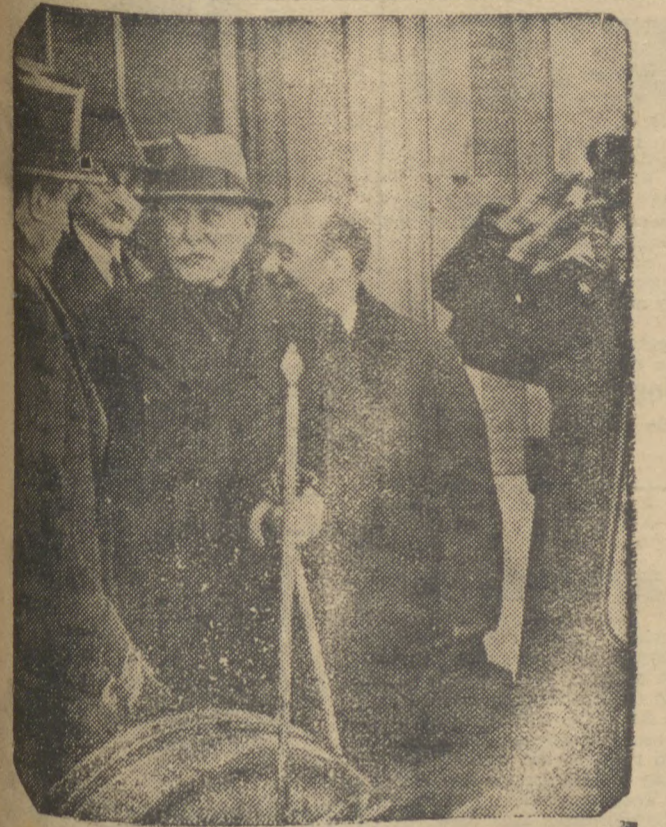
PARIS, 8 agosto (Diario) — Com a victoria das forcas nacionalistas, as relações com a Franca, em que pese a tradicional amizade entre a Espanha e a grande patria de Joffre, pareciam perturbadas. O