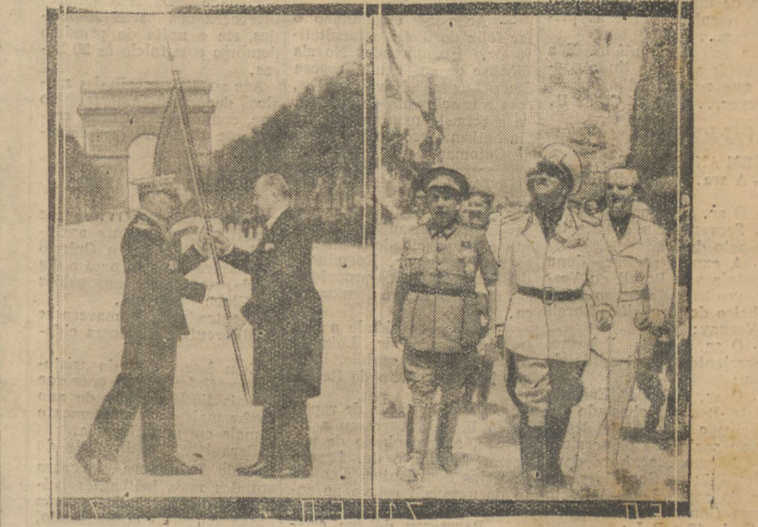
1.º O 14 DE JULHO EM PARIS — O presidente Lebrun entrega uma bandeira, como parte das festas, em Paris, do Dia da Bastilha, que este ano foi mais solene que habitualmente. Ao fundo, o panorama bem conhecido do Arco do Triunfo. 2.º CIANO NA ESPANHA — Em sua viagem á Espanha, o ministro dos Negocios Estrangeiros da Italia, conde Ciano, chegou a Arragona, que possui muitos monumentos do tempo romano. A direita do conde Ciano, o ministro do Interior espanhol, sr. Serrano Sunner, que é cunhado do general Francisco Franco.

Logo que chegue a primeira dessas maquinas, será empregada em experiencias entre esta capital e o Rio Grande do Sul, utilizando somente hulha brasileira.