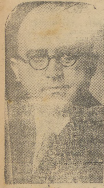
Ministro Waldemar Falção

UM PARECER DO MINISTRO DO TRABALHO SOBRE UMA CONSULTA DO SINDICATO DA SOROCABANA