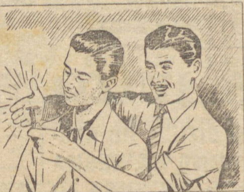
— Ficaste com água na boca? No teu caso, o que resolve é a Gillette... A aparência, meu caro, é tudo!