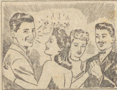
— Gillette resolveu! Já vi que o namorado pegou... Ele está lá, não a prova de que o meu conselho foi bom...