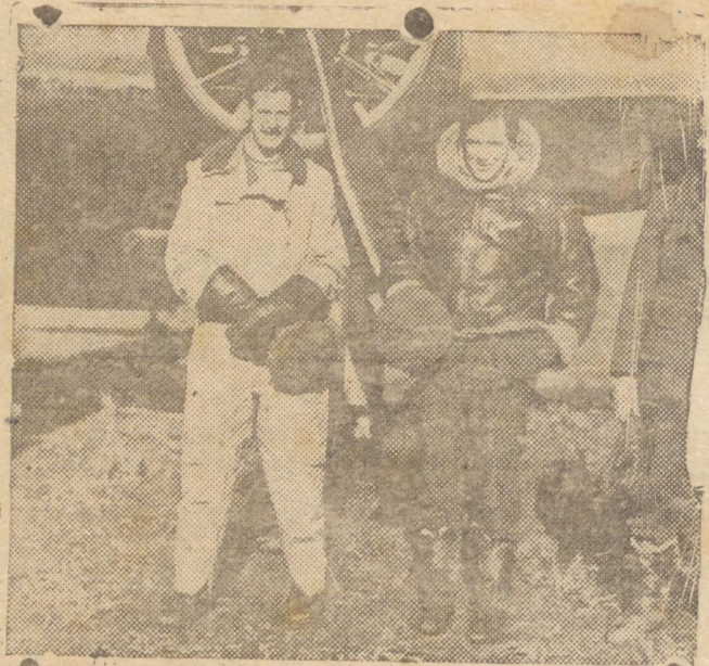
DEPOIS DA VISITA FEITA A TURIM — De regresso do ataque contra Turim esses três tripulantes de um aparelho de bombardeio da RAF, sentiram calmamente para o fotografo.