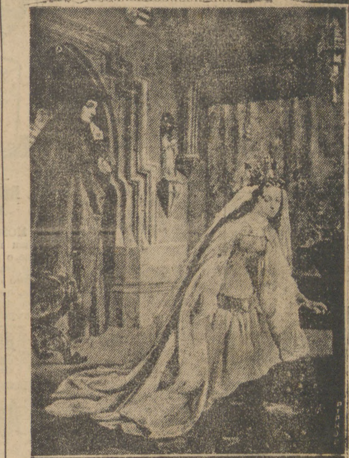
Rainha Hedwiges, uma das santas da Polónia

VARSOVIA, 5 (D.) — Precisamente ás 17 horas de hoje, o sr. Adolf Hitler, Chanceler do Reich, fez a sua entrada triunfal em Varsovia, passando