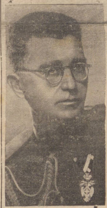
O BRAVO GENERAL DRAGA MIHAILOVITCH

NEW YORK, 2 (U.P.) — URGENTE — A emissora de Dragar informou que o general Draga Mihailovitch expedito um co-