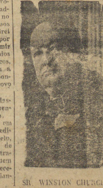
SR. WINSTON CHURCHILL

LONDRES, 27 (UP) — Informa um jornal londrino que o Rei Jorge VI, conferirá o título de duque ao sr. Winston Churchill. Acrescenta que Churchill pretende deixar as atividades políticas, recolhendo-se à vida privada.