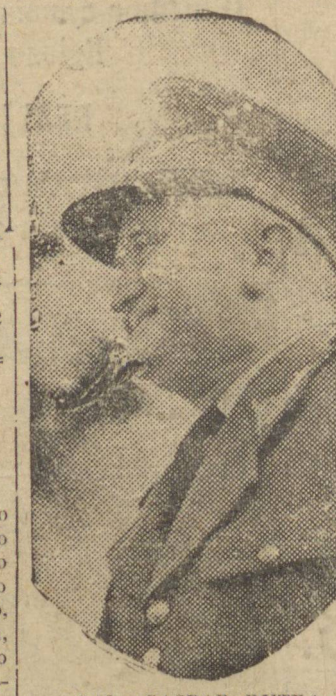
GAL. GASPAS DUTRA

RIO (27 PP) — Notícias um vespertino que o gal. Gaspar Dutra deixará a pasta da Guerra no dia 4 de agosto, afim de desincompatibilizar-se para as próximas eleições e para dedicar-se à campanha eleitoral.