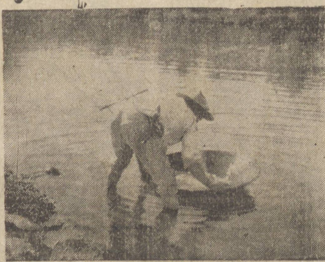
UM GARIMPEIRO PENEIRANDO O CASCALHO NO RIO TIBAGI

FALTAM GARIMPEIROS ALI. ATE' NO "SEQUEIRO" TÊM SIDO ENCONTRADAS PEDRAS PRECIOSAS !