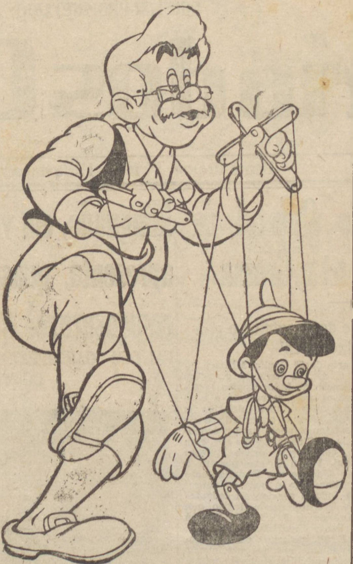
A 2ª maravilha toda colorida e falada em português, de Walter Disney, apresentada pela R.K.O. Radio!