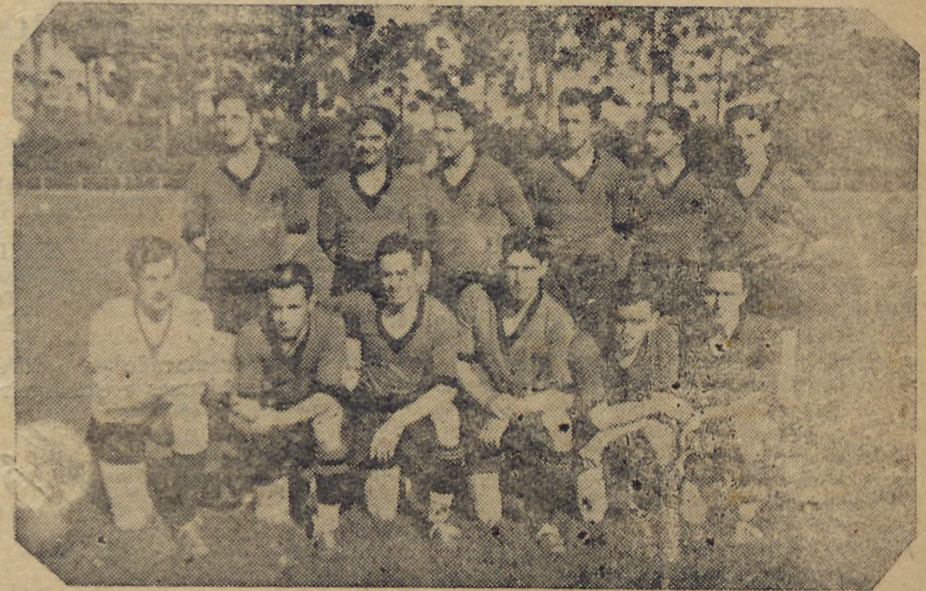
OS FORTES CONJUNTOS DO OLINDA E DO GERMANIA FARÃO A PRELIMINAR