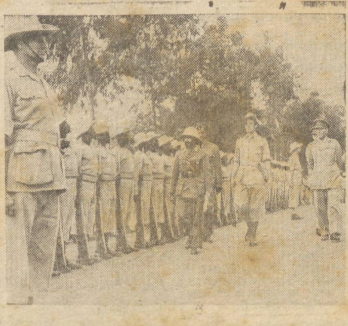
O NEGUS, EM COMPANHIA DE OFICIAIS AUSTRALIANOS, PASSA EM REVISTA TROPAS ABISSINIAS.

LONDRES, 16 (U. P.) — Espera-se que brevemente seja comunicada a conclusão de um tratado entre a Grã Bretanha e a Etiopia, pelo qual a Inglaterra reconhece a independência da Etiopia. As negociações já foram completadas.