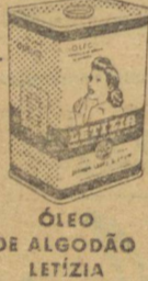
ÓLEO DE ALGODÃO LETÍZIA