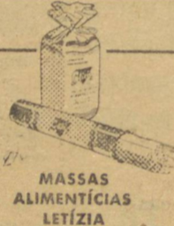
MASSAS ALIMENTÍCIAS LETÍZIA