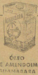
ÓLEO DE AMENDOIM GUANABARA