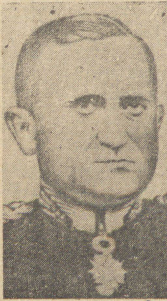
General Gaspar Dutra

E' com prazer que as massas trabalhistas brasileiras percebem no general Gaspar Dutra tão funda e plastica compreensão dos problemas do momento, nos quais está bem integrado. Enquanto a oposição, com o brigadeiro Eduardo Gomes, se mostra tão infensa ao progresso das reivindicações humanas, colocando-se combativamente contra as esquerdas, mostran-