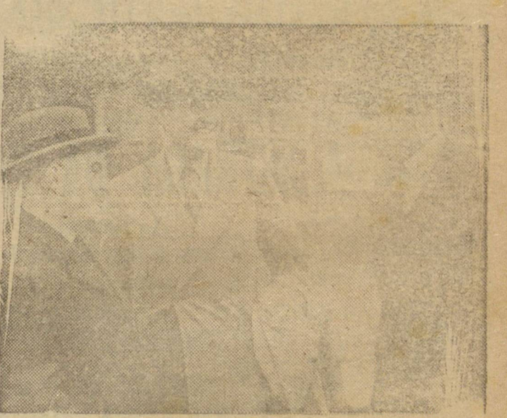
HARRIMAN, EMBAIXADOR DOS ESTADOS UNIDOS EM MOSCOU, AO CENTRO, AO LADO DE EDEN E MAISKY

MOSCOW, 17 (UP) — A agência "Tass" desmentiu hoje, categoricamente uma notícia que se diz ter sido divulgada pelo "New York Herald Tribune", segundo a qual houve seria discussão entre Harriman e Molotov sobre a nomeação do gal. Mac Arthur para o posto de Supremo Comandante das forças de ocupação aliadas. A agência "Tass" declarou que, na realidade, quando o governo soviético concordou com a resposta à oferta japonesa de rendição, Harriman e Molotov não se encontravam em Moscou. A notícia de que os russos quiseram apresentar um candidato foi, pois, segundo a "Tass" pura invenção.