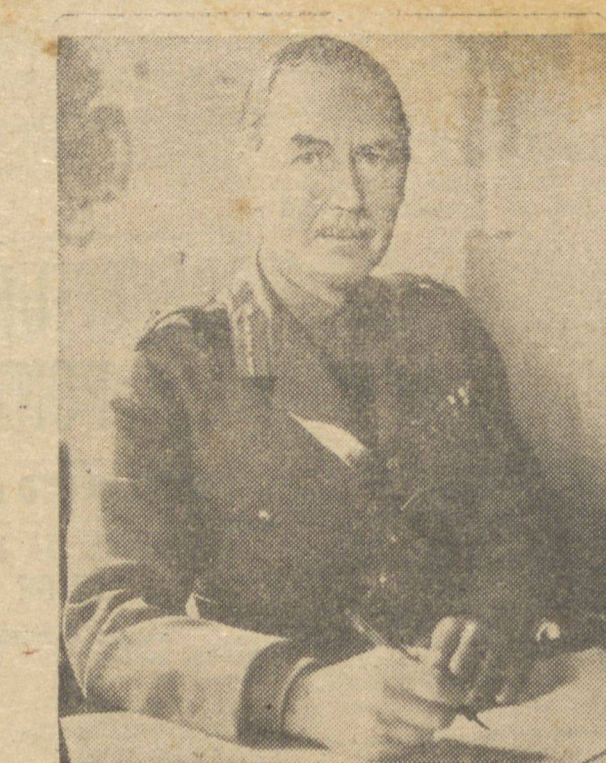
LORD LOUIS MOUNTBATTEN

SAN FRANCISCO, 17 (U.P.) — O texto da mensagem do chefe de governo e do ministro da Guerra príncipe gal. Naruhiko Higashikuni ao exército japonês, captado pela "U. Press" e transmitido pela rádio de Tóquio, diz o seguinte: "Tendo-se tomado a decisão de cessar fogo e voltar à paz, todos os oficiais e membros do exército imperial, que com espírito de luta tão elevado como sempre, mostraram heroicidade na guerra, em terras estrangeiras a milhares de quilômetros de distância ou que fez os preparativos para a defesa da pátria, devem agora depor as armas, com profundo pesar. As profundas emoções surgem nos nossos corações quando pensamos sobre o porvir do nosso estado. Sua majestade, pessoalmente ao par dos nossos sentimentos, deu ordem para cessar as hostilidades, com extraordinária decisão. Ordena-se, por esta, a todos os oficiais e soldados das forças armadas imperiais evitar o estalido das emoções, sacrificando os seus sentimentos e fazer frente à realidade serenamente e manter a sólida união e estreita disciplina para cumprir ao pé da letra as instruções imperiais. É na realidade gloriosa a honra de saber que sua majestade afirmou-se crente de que a lealdade e esforços de vossos oficiais e