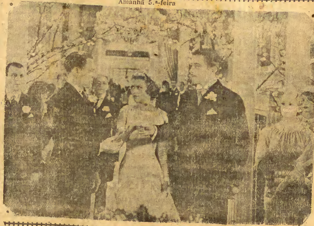
Na tela: John Boles e Ann Harding

NA PROXIMA SEMANA: Um deslumbrante romance tendo por scenario os poeticos canaes de Veneza, com a s suas gondolas e as canções admiraveis dos s seus gondoleiros.