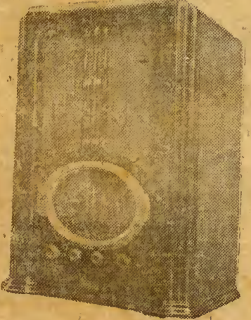
Mod. 7 valvulas