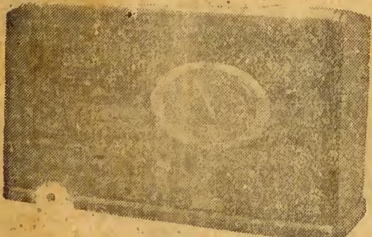
Mod. 6 valvulas

E se convencerá de que, todos, em sua casa, sentirão a verdadeira alegria de viver.