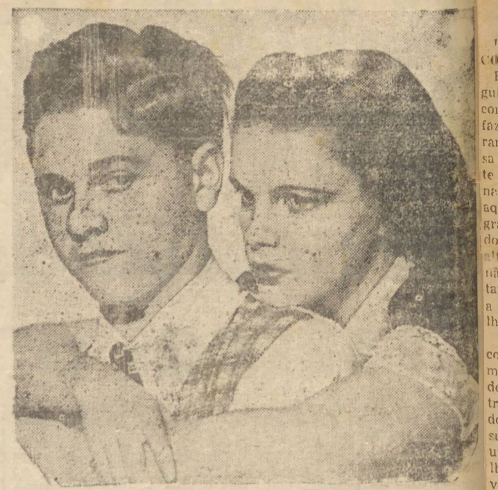
MICKEY ROONEY, AO LADO DE JUDDY GARLAND

SANTA BARBARA (Califórnia), 12 — O jovem "astro" cinematográfico Mickey Rooney, de 21 anos de idade, vai casar-se com Ava Gardner, de 19 anos e natural de Wilson (Carolina do Norte). O popular ator declinou, entretanto, dizer em que data se realizaria o seu casamento.