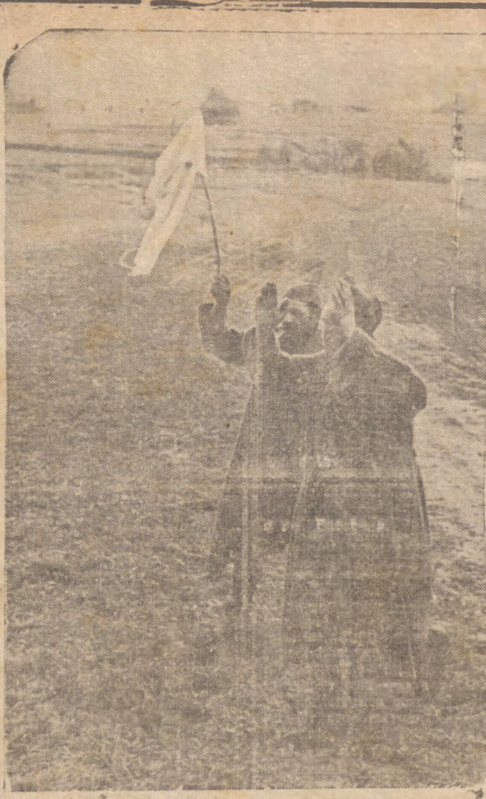
Estes guerreiros estão fartos da guerra. Com os braços erguidos e um grupo á guisa de bandeira branca, a mão, rendem-se aos soldados germanicos

WASHINGTON, 6 (A.N.) — A "Casa Branca" considerará como de grande importância o discurso que o Presidente Roosevelt proferirá na Conferência Internacional do Trabalho, hoje, ás 20 horas (17 horas do Rio de Janeiro), permanecendo no microfone por 20 minutos.