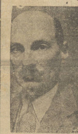
Sr. Clement Attlee, Primeiro Ministro Britânico

LONDRES, 7 (UP) — Reuniu-se esta noite a mais importante reunião do novo gabinete trabalhista, desde a época em que o mesmo foi organizado. A reunião foi presidida por Clement Attlee e contou com a presença, além dos ministros, dos secretários e conselheiros do primeiro ministro. Acredita-se nos meios bem informados que foram discutidos problemas relacionados á guerra contra o Japão e a bomba atômica. Calcula-se que também foi ventilado o programa de assuntos internos que serão incluídos no discurso do rei, na sessão inaugural do novo parlamento.