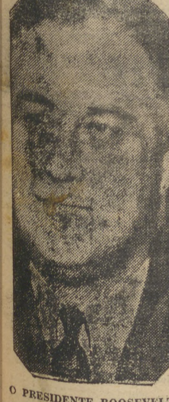
O PRESIDENTE ROOSEVELT

O PRESIDENTE DESISTIU DE CONSEGUIR O LEVANTAMENTO DO EMBARGO — COMENTARIOS DA IMPRENSA