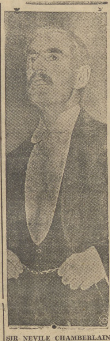
SIR NEVILLE CHAMBERLAIN