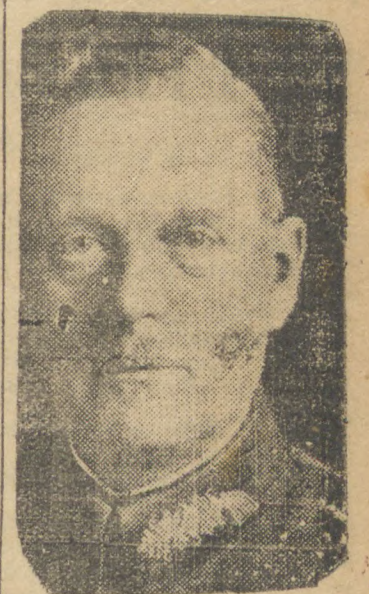
General Von Keitel, chefe do Estado Maior do exército teuto

de reconhecimento sobre Stuttgart, Nuremberg e outras cidades alemãs. Um dos aviões não regressou à sua base. PARIS, 11 (U. P., agência norte-americana) — Hoje, às 14,45 horas, soou o alarme nesta capital, obrigando a população a procurar os abrigos anti-aéreos. O alarme durou 1 hora e 10 minutos.