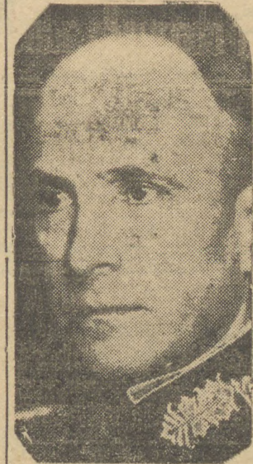
Von Brauchitsch, generalissimo das forças germanicas

BERLIM, 11 (T.O., agência alemã) — Em relação a iniciativa de paz, belga-holandesa, acredita-se que o governo alemão está preparando uma resposta logo que os departamentos competentes tiverem concluído os exames da questão.