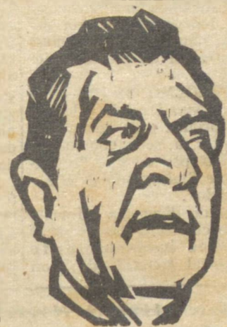
SR. BATISTA LUZARDO

URUGUAIANA, 30 (Asapress) — Comunicando-se telefonicamente com a Embaixada do Brasil em Montevideo, "Asapress" entrevistou o embaixador Batista Luzardo, que disse que chegará a esta cidade no próximo dia 2, com a missão uruguaia, composta de 22 membros, lotando dois aviões. Sobre o certame, disse s. exa.: — "Meu juízo é que o certame de Uruguaiana, tendo inicialmente significado apenas uma parada regional, torna-se agora uma tal transcendência, que não tenho dúvidas, será o ponto de partida para um melhor entendimento entre os países sul-americanos, que se pecuária e na agricultura têm a base fundamental da sua economia. Mais do que nunca estaremos aproximados, tornando-nos um bloco sólido, um só pensamento — o progresso, que