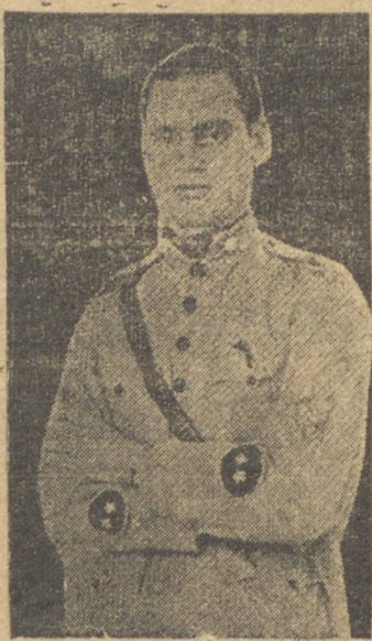
CORONEL JUAREZ TAVORA

1610, 16 (Press Parga) - O coronel Juarez Tavora, comandante do Regimento "Vilagrã Cabrita", endereçou ao ministro da Guerra a seguinte carta: "Rio, 12 de março de 1945. Eminente chefe e amigo Dutra. Acabo de ser informado que será lançada amanhã, oficialmente, em S. Paulo, a sua candidatura à presidência da República. O conhecimento desse fato e de outros com ele rela-