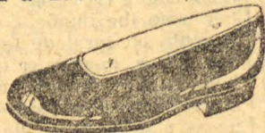
Superior, verniz preto forrado de branco, salto de sola baixo, bom acabamento; de 32 a 40... 19$000