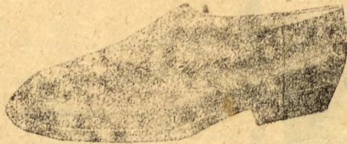
INGLEZ Pellica preta, raso, com elastico. Referencia: 1010

O lemma da casa é Vender barato para vender muito