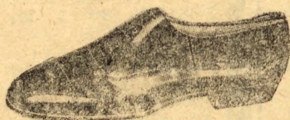
ROCHA. Botinas de abotonar ao lado. Gaspia, marrom e preta, latão, cinza e beje.