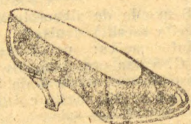
Raso em verniz preto. Todo picotado e forrado de branco. Salto Luiz XV. Mesmo modelo em pellica preta finissima... 30$000