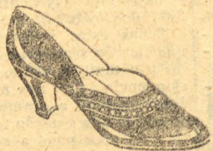
Superior verniz preto, raso, moderno: com picote ao redor da gashia: forrado de branco. Salto Luiz XV cubano, alto, 32 a 40... 29$000

Calçados mexicanoss Em todas as corem 20% menos do que ea qualquer outra cas