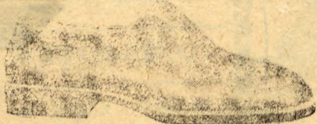
LUX (Referencia 1043) Boscál em vinho e preto.