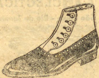
ROCHA (Referencia 4301). Em verniz preto, artigo finissimo para passeios e soirées