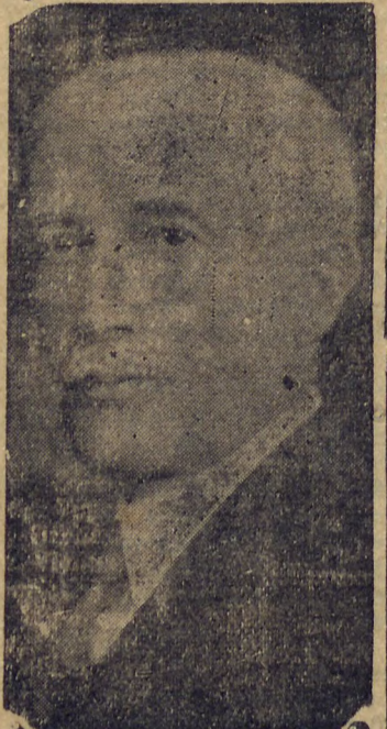
SR. ANTONIO CARLOS

RIO, 7 (D.) — Os meios parlamentares esperam ter definitivamente approvado até 3 de novembro proximo o orçamento geral da Republica para o exercicio vindouro. Sabe-se que o presidente da Camara, sr. Antonio Carlos, após a votação da nossa lei de meios, embarcará para Buenos Aires, em visita ao seu irmão, embaixador José Bonifacio.