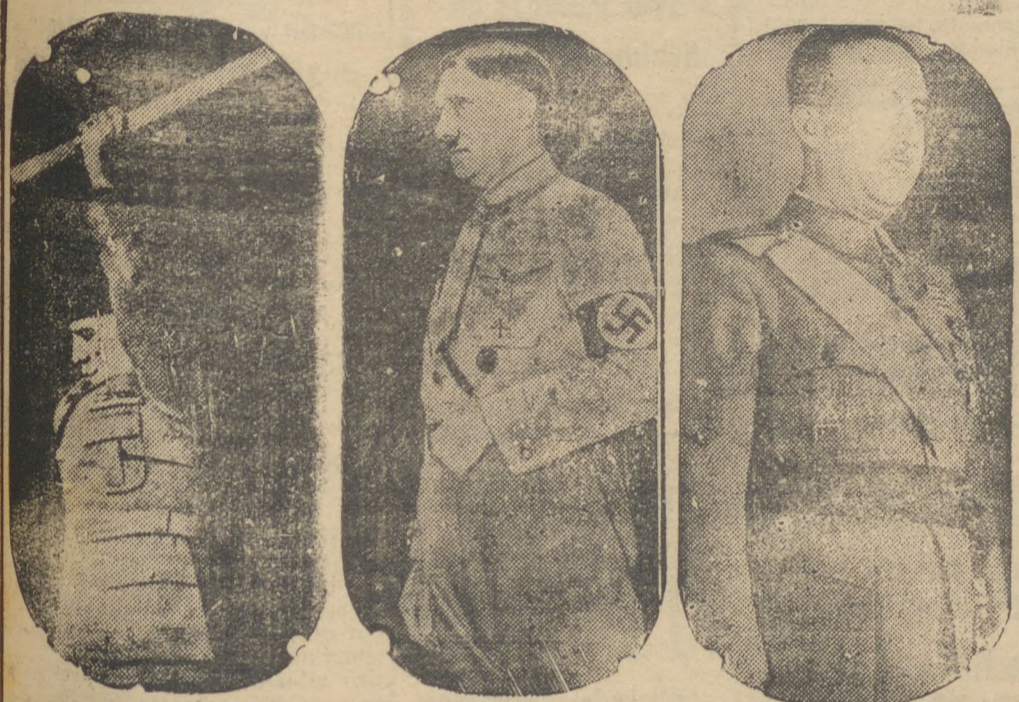
Mussolini OS GRANDES JOGADORES DO "POCKER" Hitler Franco UNIVERSAL...