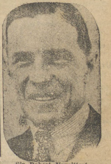
Sir Robert Vansittart

Um Serio Incidente Para As Relações Teuto-Polonesas Um Oficial Alemão Assassinou Um Guarda-Aduaneiro Polonês! DANTZIG, 20 (D.) — Quando um oficial da alfandega alemã estava fazendo a sua patrulha perto de Postelau, notou que um oficial alfandegario polonês estava lhe apontando a arma, sem previo aviso. O alemão fez uso da sua arma, matando o guarda-polonês. O Senado de Dantzig ordenou uma investigação do incidente.