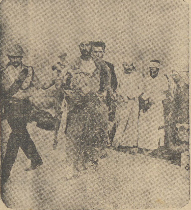
Prisão de Agitadores Arabes Nr Palestina

JERUSALEM, 20 (D.) As tropas inglesas acabam de reiniciar uma severa campanha de repressão contra os agitadores arabes, que ha varios anos ameaçam o prestígio do Reino Unido e trazem em estado de permanente agitação a Terra Santa. O odio aos judeus e a defesa do territorio que ocupam, ha tantos seculos, e ainda a incompatibilidade de raça e de religião tornam impossível o restabelecimento da paz e da tranquilidade naquella vasta região occupada pelos arabes. Os ingleses fazem prisões de agitadores, ma s os atentados se renovam constantemente. E ameaçam paralisar completamente a imigração israelita, alem de obrigar a Inglaterra a aumentar os seus efetivos militares de occupação em toda a Asia Menor.