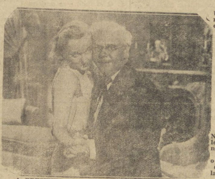
Um grande filme 100% colorido da "UNITED ARTISTS", com dois astros de fama