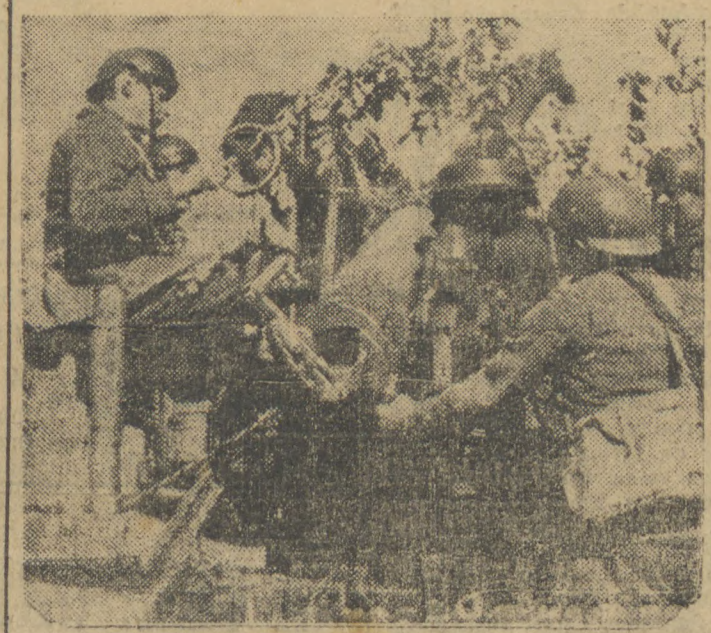
Peça de artilharia em ação "num ponto" do front ocidental.

O REICH ESTARIA DESAPONTADO COM A FRACA REACÇÃO DOS PAISES NEUTROS EM FACE DAS MINAS MARINHAS