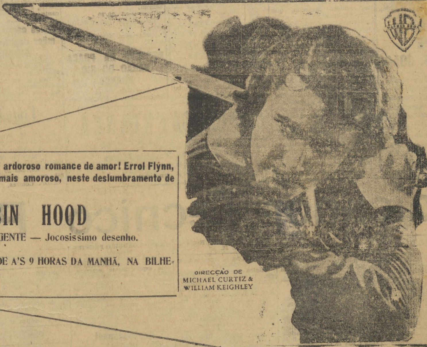
DIRECCAO DE MICHAEL CURTIZ & WILLIAM KEIGHLEY

ROBIN HOOD DEVE SER QUALIFICADO COMO OBRA-PRIMA DO TECHNICOLOR. E' O MAIS SENSACIONAL QUE JA' SE VIU E O QUE MAIS INTENSAMENTE PODE EMOCIONAR, DESDE QUE O CINEMA EXISTE!