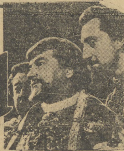
Patric Knowles Eugene Pallette Alan Hale Melville Cooper Ian Hunter Una O'Connor

OLIVIA De HAVILLAND BASIL RATHBONE • CLAUDE RAINS