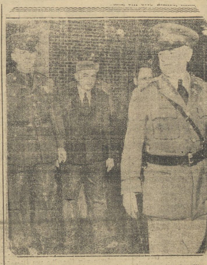
CIDADE DE NOVA YORK, novembro — (Serviço da "Illustrated International News, de Nova York, por via aerea). — Grover Cleveland Bergdoll, o famoso estelionatario, desde os tempos da Grande Guerra, aparece nesta gravura, quando era escultado por oficiais do exercito norte americano, aparendo, perante o tribunal militar, afim de responder pelo crime de deserção do Exercito estadunidense, naquela época. Bergdoll declarou, que havia voltado aos Estados Unidos subrepticamente, tendo residido em Filadelfia durante a maior parte do tempo, desde 1929, até que, tendo regressado da Alemanha na primavera passada, resolveu entregar-se ás autoridades.

BERLIM, 29 (T. O., agência alemã) — Segundo se anuncia oficialmente, foi travado hoje um combate aereo entre um avião alemão de reconhecimento e um aparelho britânico de caça sobre a região inglesa do condado de Northumberland. O aparelho alemão, que voava a grande altura, foi surpreendido entre as nuvens pelo aparelho de caça inglês, recebendo diversas rajadas de metralhadoras nas abas, sem no entanto sofrer avarias de monta. Os dois aviões chegaram a se defrontar numa distancia de 50 metros, metralhando-se reciprocamente. Após um certo tempo o avião inglês abandonou a luta, descendo em espiral e desaparecendo entre as nuvens. O aparelho alemão voltou então sem novidade à sua base após cumprir cabalmente a missão que fôra confiada á sua tripulação.