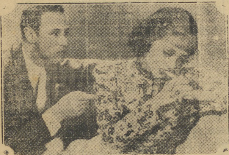
A Warner apresenta a grandiosa produção, que é um mimo de amor e hilaridade:

(O PALACIO ENCANTADO DA PRAÇA RIO BRANCO — TELEFONE 1-1-1)