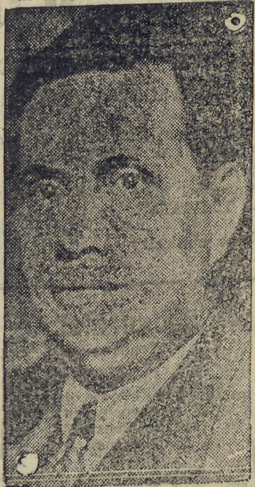
GENERAL GÓES MONTEIRO

As palavras textuais do general Góes Monteiro são as seguintes: "Dentro das proprias classes militares e em outras instituições do Estado, existem elementos a soldo de comités estrangeiros, a cuja direcção obedecem, com a incumbencia de promover a seiscão e indisciplina entre as forças armadas e tramar