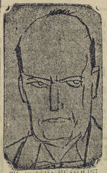
SR. BENITO MUSSOLINI

dois milhões de homens, dos quaes 50.000 são mantidos permanentemente em armas. O exercito é equipado e municiado com os armamentos