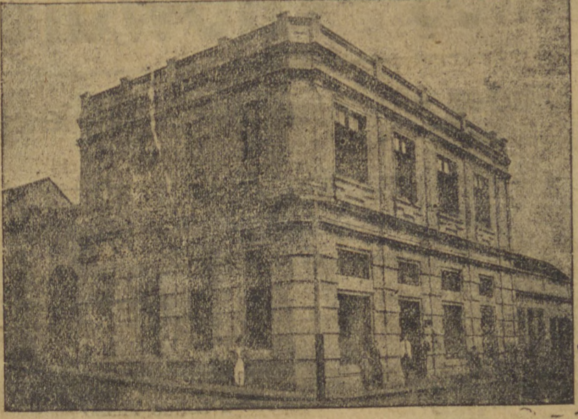
RUA 15 DE NOVEMBRO N. 37 ..... P. GROSSA

Sortimento das melhores marcas de relógio do mundo. Relógio de parede, carrilhões de 4-4, desperadores, relógios de bolso Omega, Cyma, Interna cional VWatch, Levis, Chronografo para tirar tempo de corridas. Vasto sortimento de relógios de pulso para homens e senhores para presente em aparelhos brilhantes, ouro e platina. Sortimento de artigos finos para chá, café, etc. Finas canetas tinteiro. Especialista em optica. Linhas das imagens de Sastos. Sortimento completo em alianças para prompta entrega. Officina de Relojoaria e Ourivesaria.