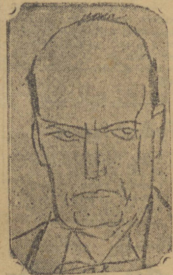
Mussolini, o grande reformador da Italia

ROMA — Em todas as principais cidades das provincias foram distribuidas as re-