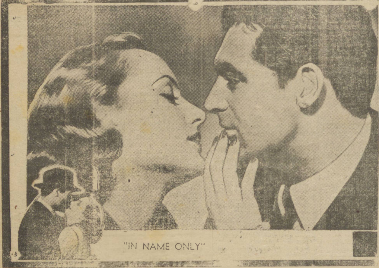
"IN NAME ONLY"

HOJE! — Domingo, em 2 sessões: 1ª ás 7 horas; 2ª ás 9,15 — O maior, melhor e mais sensacional programa da cidade!