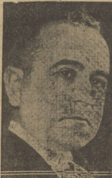
Senhor Getulio Vargas

RIO, 13 (D) — Mme. Vargas é esperada sabbado, 15, visto que a illustre dama vem preparar e dirigir o Natal das Crianças Pobres, as quaes costumam ir receber num