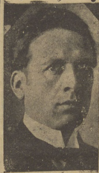
General Flores da Cunha

S. PAULO, 13 (D) — A estas horas (duas da tarde), devem estar conferenciando