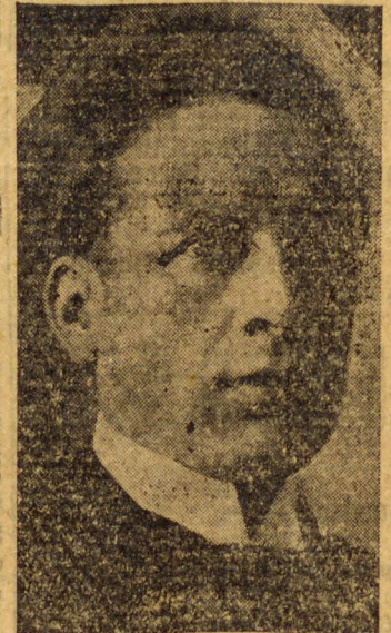
O general Flores da Cunha, cuja attitude em face do actual movimento não está ainda bem declarada

Adeantam essas noticias que os dois Estados subleva-