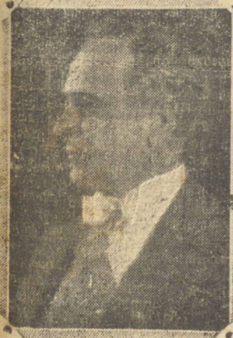
Pres. GETULIO VARGAS

Disse o sr. Getúlio Vargas, falando aos manifestantes, depois de reiterar que não pensa em aceitar a sua candidatura