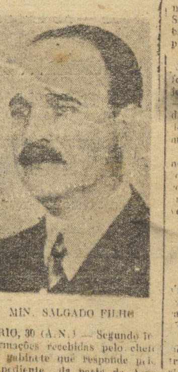
MIN. SALGADO FILHO

náutica, a viagem do ministro Salgado Filho à Inglaterra, que culminou-se dentro das condições previstas. A travessia do Atlântico, de cidade Bathurst, na África, foi feita em ótima condições e levou 56 horas. — (Uma do Rio de Janeiro) "York" partiu daquela cidade rumo à Bahia, ali chegando às 12,10, onde o ministro alanceou. O titular da Aeronáutica, pernambuco em Bahía, o general britânico da R.A.F., que o conduziu a sul, ao Brasil, rumará amanhã para Londres, onde deverá chegar ao meio-dia. Incendio nos estaleiros Kayser PORTLAND, 30 (U.P.) — Violento incendio irrompiu nos estaleiros Kayser de Oregon, australem prejuizo no valor de 5.000.000 de dólares. Foram destruídos completamente 6 navios acabados de construir, sendo 4 do tipo "Vitoria" e 2 transportes de guerra.