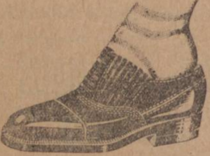
SAPATO COM ELASTICO INVISIVEL

Referencia 205. — Em pelica preta ou marron, feito nas fermas franceza e americana