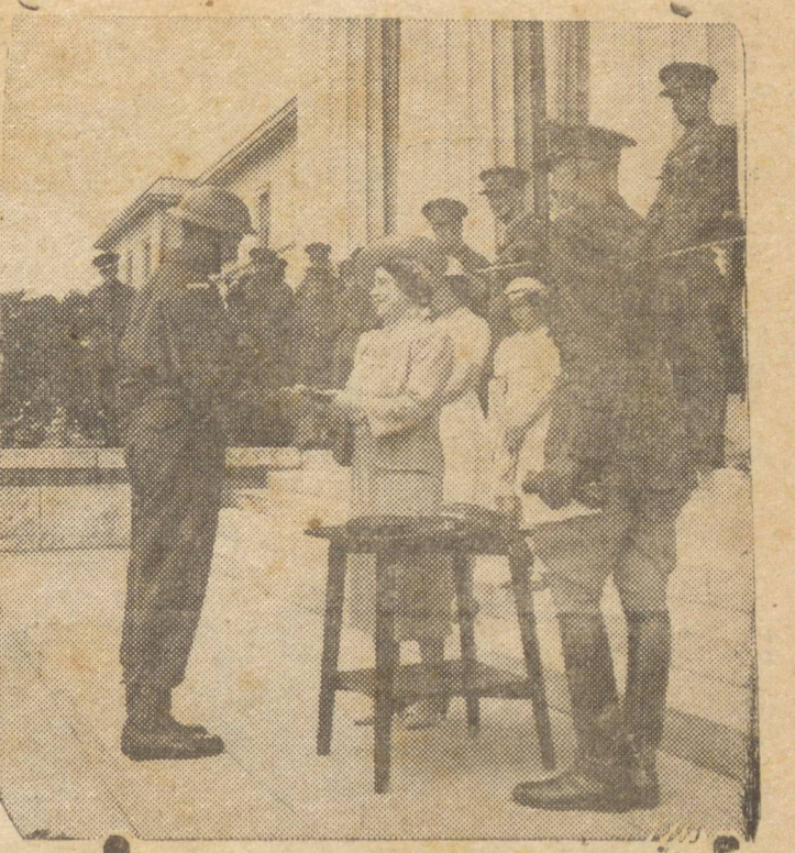
Rainha Elizabeth, da Grã Bretanha, cumprimenta soldados ingleses. GLASGOW, 10 (U.P.) — Sua Magestade, Rei Jorge VI e a Rainha Elizabeth, estiveram hoje em visita a um aerodromo escocês, compartilhando depois, a um dos estaleiros desta cidade, onde receberam entusiasticos aplausos de todos os operarios.