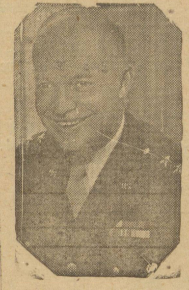
Nessa ocasião o ministro Ar- mando Trompowski fará entre- va ao eminente chefe militar da Grã Cruz do Mérito da Aeronautica, com que foi agraciado pelo presidente da Re- publica. A condecoração terá lugar em presença de todos os brigadeiros atualmente nesta capital, da officialdade, alunos da tropa da Escola.

RIO, 5 (AN) — Como pai- te do programa elaborado, o general Eisenhower visitou, hoje á tarde, a Comissão Mix- ta Brasil-Estados Unidos, que funciona em dois pavimentos do Palacio do Exército, ali ten- do chegado em companhia do embaixador norte americano e dos generais Mascarenhas de Moraes e Canrobert Pereira da Costa. Coronel Bina Machado e maior Vernon Walters, estã oficiais da embaixada norte- americana. Recebido no salão de honra por todos os mem- bros daquele órgão, seu presi- dente, general Filza de Cas- tro fez um discurso de recepção ao ilustre visitante.