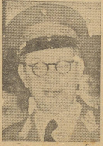
mo fato poz em polvorosa a população de diversas cidades do interior, notadamente Os...

RIO, 5 (AA) — "Diretri- zes" anuncia estar eminente a intervenção militar em São Paulo, esperando apenas o go- verno o relatório do comando 2.º Região Militar, adiantando se que o fato prende-se á greve dos ferroviários da alta paulista que, apesar de apun- ciar-se a cessação, continua,