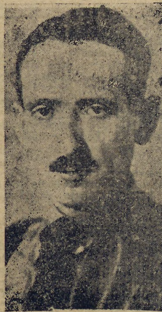
— SR. PLINIO SALGADO —

rios nacionaes, directores de departamentos nacionaes, chefes provinciaes, seus secretarios e os chefes municipaes que desejarem participar dessa assembleia integra-