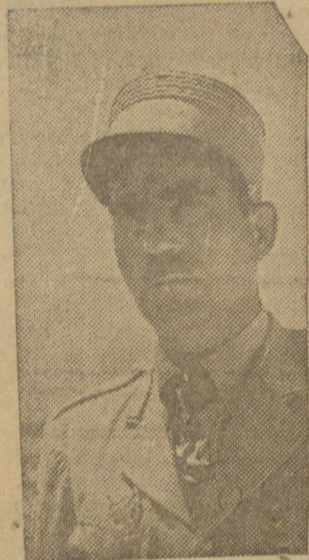
GENERAL DE GAULLE