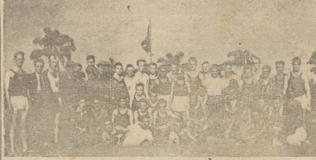
Foto fotográfica da primeira competição da L.P.A. realizada a 10 de agosto p. passado com o concurso das equipes do Adler, Guarani e Juventus. Vê-se os atletas daqueles 3 clubes, diretores e juizes que funcionaram no grande certame

O constante mau tempo prejudicou o treinamento dos competidores