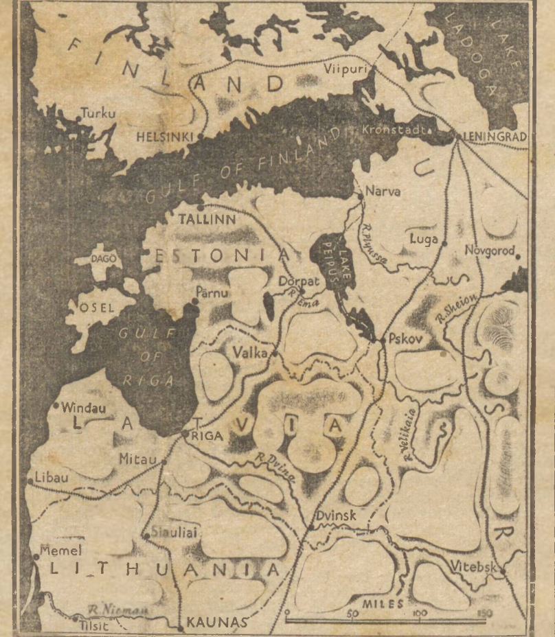
Com uma outra ação, a fortaleza aparece envolvida em nuvens de fumaça.

O correspondente de um jornal sueco na Finlândia informa que desde Terijoki, a 15 milhas de Kronstadt, se pode ver a base naval russa sujeita a bombardeios constantes, mas as baterias da ilha e