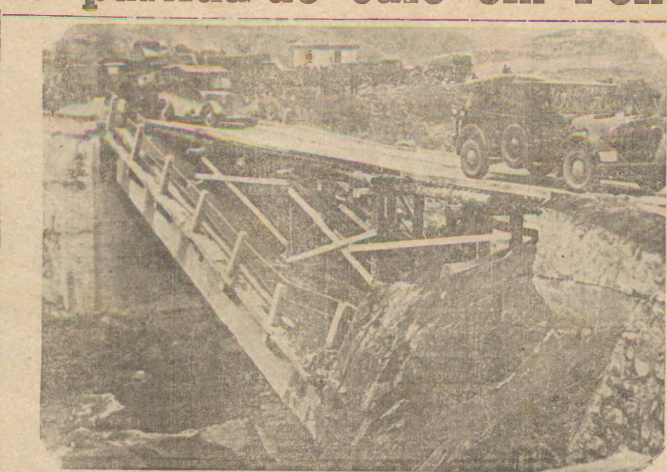
NA FRENTE ORIENTAL — Nem a destruição de pontes por parte do adversário pode impedir o avanço alemão. O clichê apresenta uma ponte provisória construída por sapadores alemães em território inimigo.

pouco escrupulosos sóem impingir café de infima qualidade, misturado com toda a sorte de impurezas vendendo-o, não obstante, pelos altos preços de venda, um produto se-