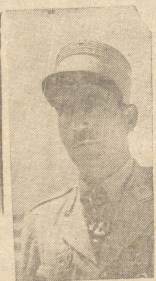
General De Gaulle

Em abril de 1941, fez dele o seu presidente do Conselho e, atualmente cedeu-lhe todos os poderes. No futuro Pétain poderá ser um reliquia nacional, mas, nunca um símbolo ou um exemplo. O mesmo Darlan, pode ser nesse momento muito útil e por conseguinte, um instrumento temporário para facilitar o desenvolvimento das operações militares da África do Norte, mas suas reviravoltas não podem obter para ele quaisquer simpatias e confiança. Para os ingleses ele será sempre o homem mais