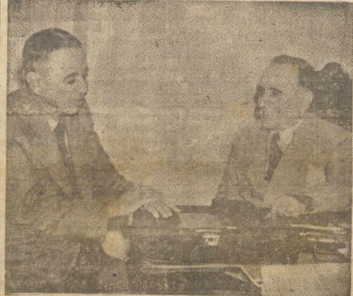
O Presidente Getulio Vargas quando em entrevista ultimamente no Rio com o Interventor Manuel Ribas

LONDRES, 12 (U. P.) — Informações fidedignas indicam que a população civil da capital italiana já procura abrigo para um lugar onde fique exposta a possíveis bombardeios aéreos aliados.