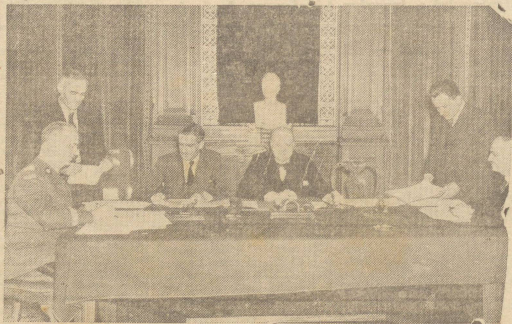
Vemos no clichê o General Sikorski quando, no Foreign Office, realizou-se a assinatura de um acordo entre a Polônia e a U.R.S.S. O líder polonês é visto ao assinar o acordo, vendo-se na procena mais os srs. Anthony Eden, Churchill e Maisky, este representante do governo russo.

der. Teriamos, então, os alemães dominando o Volga e consequentemente a possibilidade de um ataque germanico em duas direções: uma para o Norte que atingiria a zona de Moscou pela retaguarda, e outra para o Sul visando diretamente Astrakan, o que seria o isolamento do Caucaso. Mesmo que Stalingrado caísse hoje ou amanhã, o fato já não teria maior repercussão militar. Tal, entretanto não se dá, porque os alemães viram desaparecer as melhores possibilidades que podiam ter neste sentido, esborçando-se todas na magnífica e valente resistência das tropas russas. Quando começou a guerra entre a Alemanha e a Rússia fui dos poucos que acreditaram