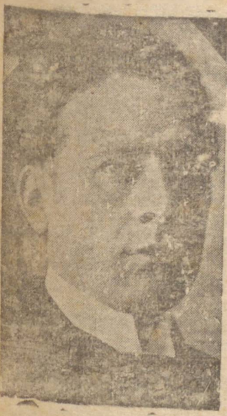
Sr. Flores da Cunha

RIO, 6 (A. N.) — URGENTE. — O Departamento de Imprensa e Propaganda distribui hoje, à imprensa local, o seguinte comunicado: "O sr. Flores da Cunha, ex-governador do Estado do Rio Grande do Sul, apresentou-se às autoridades daquele Estado afim de cumprir a pena que lhe foi imposta pelo Tribunal de Segurança Nacional. O sr. Flores da Cunha foi