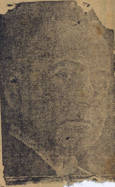
Sr. Getúlio Vargas