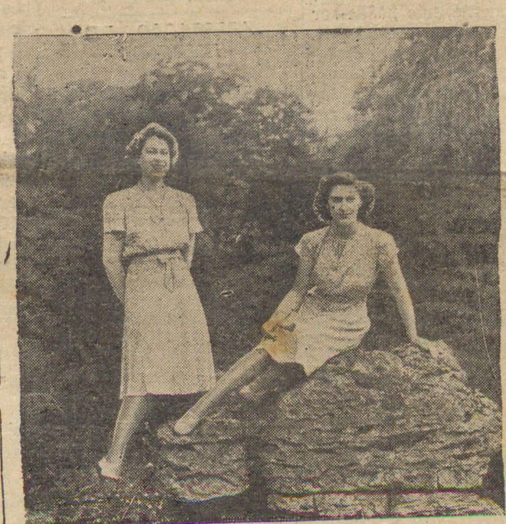
A Princesa Elizabeth e em companhia de sua irmã, princesa Margareth

LONDRES, 15 (Especial) — O rei George VI deu sua bênção ao romance real de sua filha de 21 anos, a princesa Elizabeth, com o tenente naval Philip Mountbatten, ex-príncipe da Grecia e da Dinamarca. O comunicado do noivado da futura rainha da Inglaterra, que estava sendo esperado