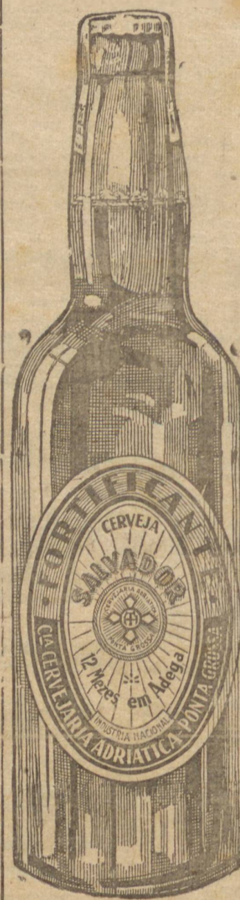
Aberto o concurso

RIO, 1 (A. N.) — O sr. Presidente da Republica autorizou a abertura entre artistas, do concurso de projetos para a construção do Estado Nacional e Escola de Educação Física, como também o prazo para a apresentação dos trabalhos, o qual se dá de 60 dias.