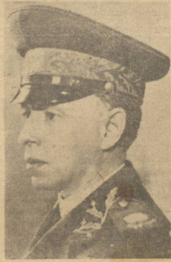
MINISTRO MENDONÇA LIMA

CURITIBA, 21 (Pelo telefone) — Em janeiro próximo, deverá visitar o nosso Estado o gal. Mendonça Lima, Ministro da Viação e Obras Públicas. O ilustre visitante aproveitará a oportunidade de sua viagem ao Paraná para realizar inspeção as instalações da R.V.P.S.C. Também outras repartições públicas, subordinadas à sua pasta, deverão merecer a visita de s. excia. Depois, o gal. Mendonça Lima prosseguirá onde, igualmente, inspecionará a viagem para Santa Catarina, para as repartições subordinadas ao seu Ministério. Vem o ilustre titular da pasta da Viação ao Paraná para inspecionar as minas de carvão do Rio do Peixe, no município de Tomazina, assim como as do município de Siqueira Campos.