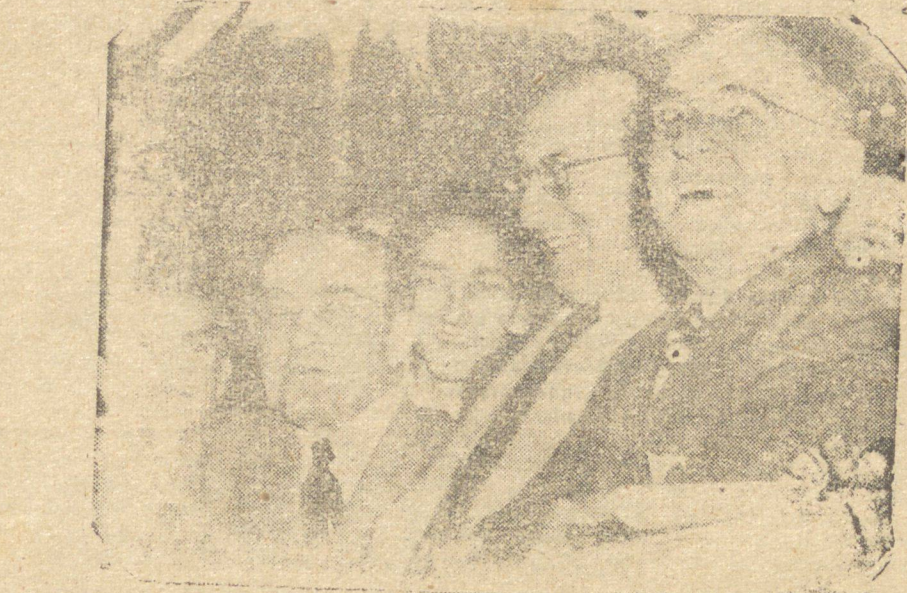
O sr. Getúlio Vargas, falando ao povo quando do último movimento "queremista", para dizer que não seria candidato. RIO, 3 Vox Press) — O sr. Getúlio Vargas, segundo a lei que ele próprio aprovou, deixou ontem de ser possível candidato à suprema magistratura da Nação, deixando de ter razão o movimento "queremista" com a terminação do prazo de desincompatibilização.