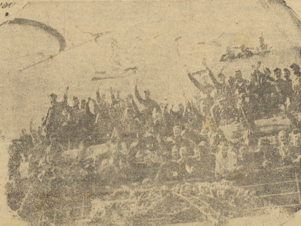
(S. H. I.) — Soldados norte-americanos que estavam combatendo na Europa apinhados no cais de desembarque de Nova York.