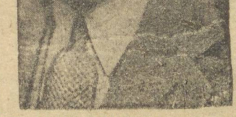
LONDRES, 3 (UP) — Clement Attlee falou esta noite pelo rádio da B.B.C., dizendo textualmente: "A comunidade britânica, o império e todos os nossos aliados sentem satisfação com a queda dos nossos inimigos, pela libertação dos nossos compatriotas que se achavam aprisionados e com a liberdade dos povos há tanto tempo submetidos ao governo japonês. Rendemos tributo aos membros do exército da marinha e da aviação, por muitos neste momento, devemos expressar nossa profunda satisfação pelo fato de, final-