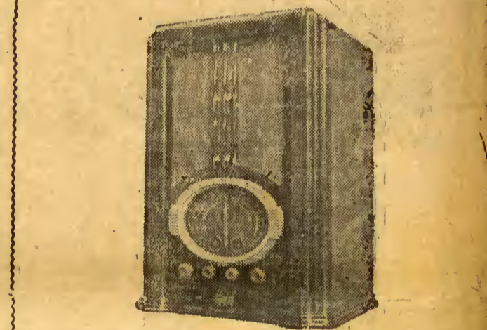
Mod. 6 valvulas