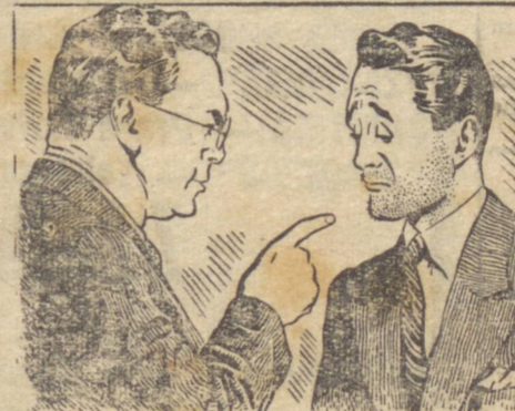
— A culpa é sua! Com um aparelho de segurança Gillette, não há perigo de contágio de infecções!