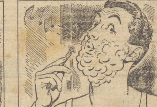
— Que proze! Tão fácil e agradável! Pena não ter começado há mais tempo a barbear-me com Gillette!