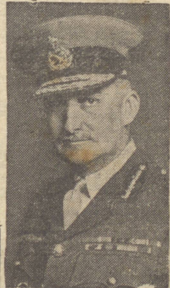
ALMIRANTE NIMITZ, Chefe da Esquadra Norte-Americana

Hong-Kong e Foochow, bem contra outros nipônicos na ilha de Formosa e Oma, afundando ou avariando nestas últimas zonas, cerca de 83 navios inimigos.