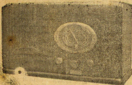
Mod. 6 valvulas

E se convencerá de que, todos, em sua casa, sentirão a verdadeira alegria de viver.