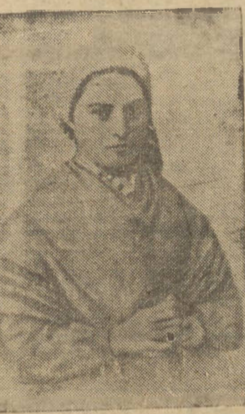
Ana Neri, a heroína brasileira, exemplo do valor e da constancia das nossas enfermeiras.

WASHINGTON, 13 (U.P.) — O Departamento, de Estado, anunciou que o presidente do Haiti, chegará amanhã aqui em visita oficial, sendo hospede oficial do Presidente Roosevelt.