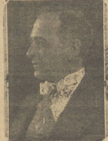
SR. GETULIO VARGAS

A Liga de Defesa Nacional, homenageando o Presidente, convidou a população da capital para hastear a bandeira do Brasil nas fachadas dos edifícios. O presidente da Liga compareceu ao Palácio, para